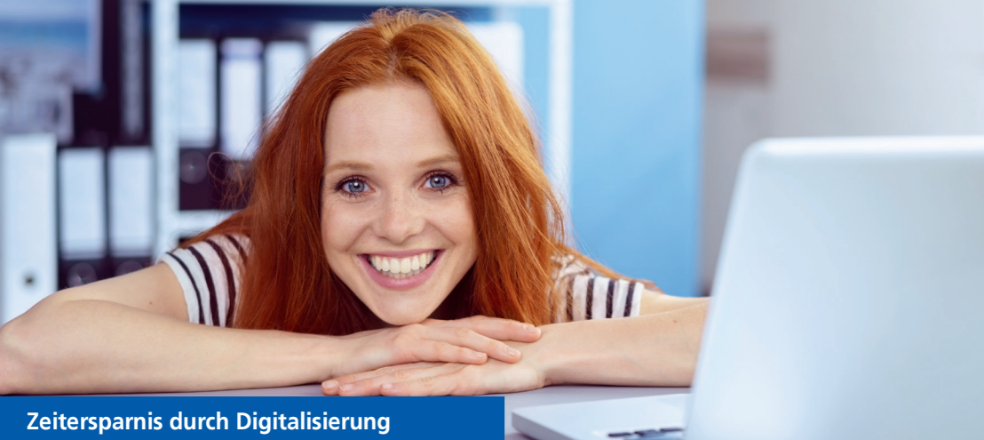
Zeitersparnis durch Digitalisierung